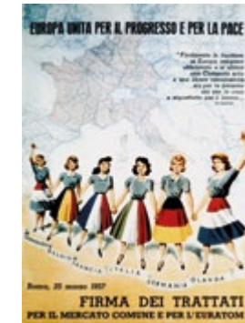
Affiche italienne en faveur du traité de Rome de 1957 Auteur inconnu

La guerre de 1870 porte en elle les germes des deux conflits mondiaux du XX e siècle. Malgré les exactions et les pires abominations, Français et Allemands ont réussi à se réconcilier dans le cadre de l'Europe.