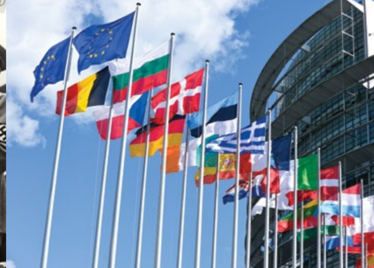
Le parlement de Strasbourg au cœur de la démocratie européenne

Le travail en atelier permet aux élèves de comprendre l'avènement des régimes autoritaires en Europe, le déclenchement, le déroulement et les conséquences du conflit sur le continent. Les élèves sont également sensibilisés à la notion de crime contre l'humanité.