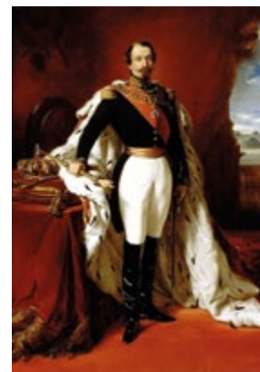
Napoléon III, 1853 Franz Winterhalter