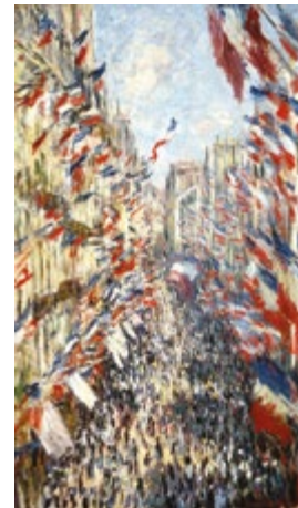
La Rue Montorgueil, 1878 Claude Monet

Après la guerre de 1870, la France entre dans une période d'incertitude institutionnelle. Le pays hésite entre la République et le retour à la monarchie et il faut attendre la fin des années 1870 pour que la République soit définitivement installée.