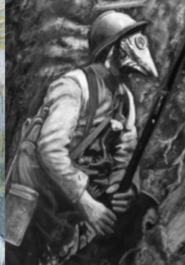
Soldat de 1914-1918 dans une tranchée se préparant à une attaque au gaz

Cet atelier offre l'opportunité aux enseignants de redéfinir les contours de ce qu'est véritablement la laïcité.