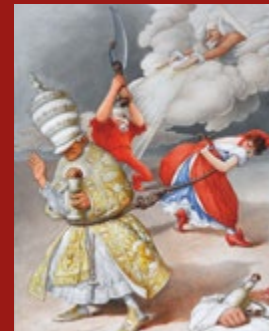
La Séparation des Églises et de l'État Auteur inconnu

Après la guerre de 1870, la laïcité progresse dans la société avec l'enracinement de la République et débouche en 1905, sur la loi de séparation des Églises et de l'État, pierre angulaire de notre République.