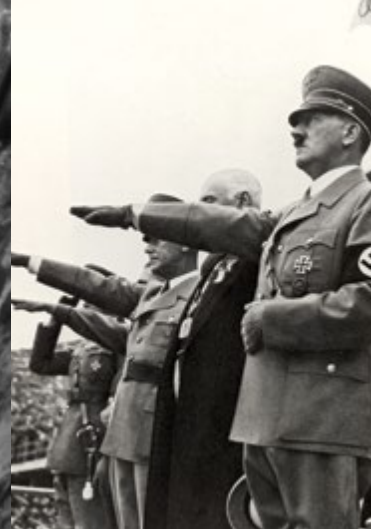
Hitler lors des Jeux olympiques de Berlin de 1936