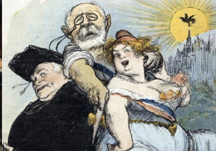
Caricature de Charles Lucien Léandre (1862-1934), Le Rire, 20 mai 1905

C'est pourquoi cet atelier propose aux enseignants de revenir sur les origines de la République française et sur ses valeurs, ses symboles et ses principes.